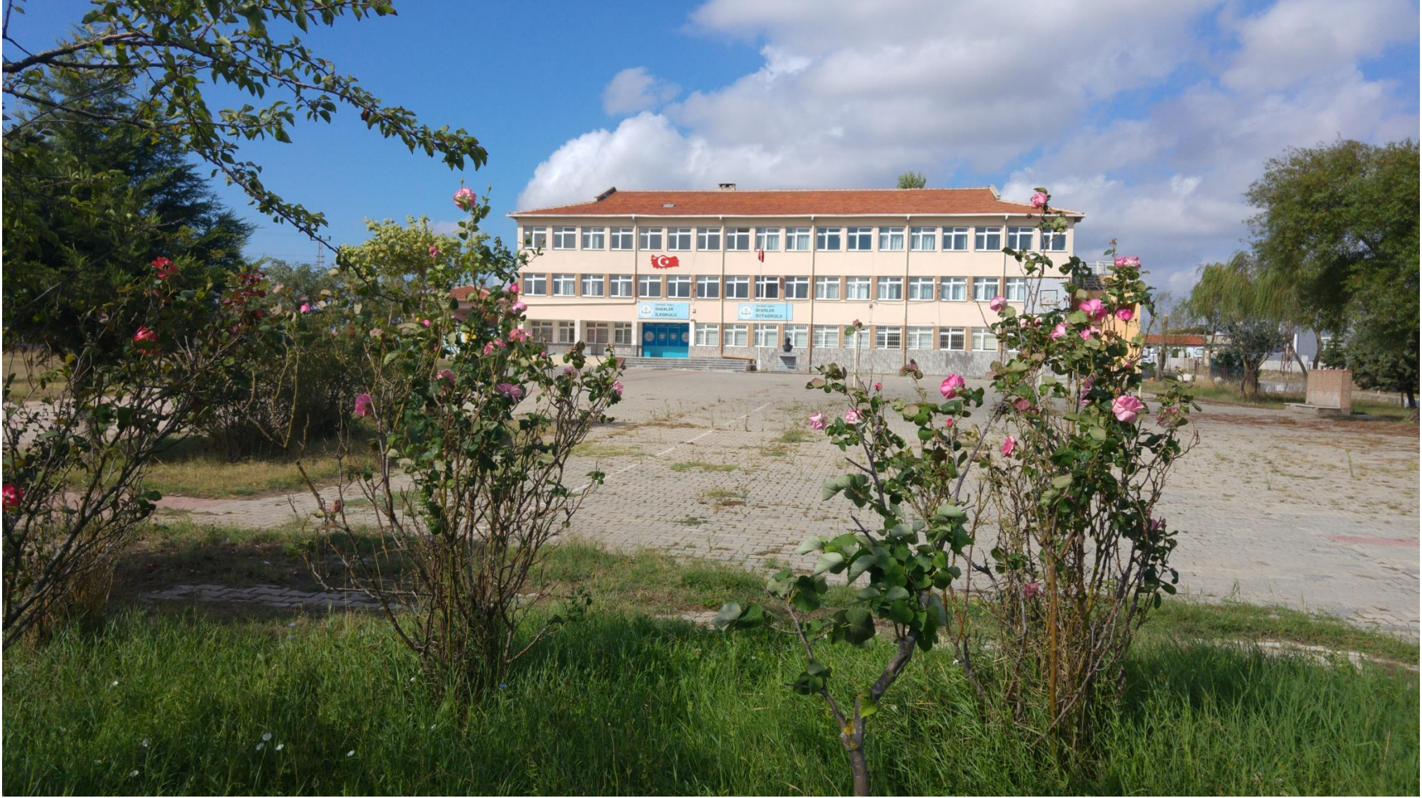
TEKİRDAĞ / ÇORLU ÖNERLER İLKOKULU&ORTAOKULU